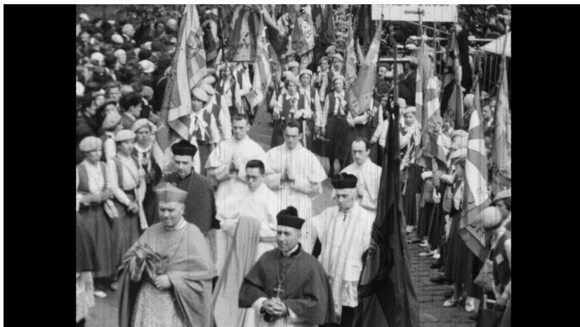
Illustratie 1 Still uit 'Viering 25 jaar Boerinnenbond', 1936 Kardinaal Van Roey wordt onder begeleiding van BJB-vlaggen naar het altaar gebracht voor een openluchtviering.

fessionele vaardigheden bij te brengen, anderzijds was het een geschikt medium om de katholiek-agrarische identiteit van de plattelandssamenleving te vrijwaren.