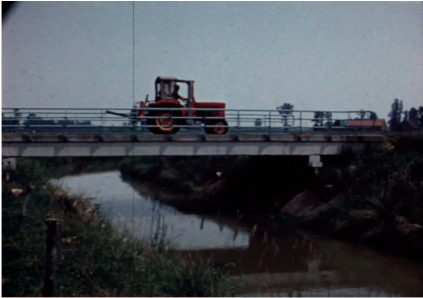
Illustratie 3 Still uit De Nationale Landmaatschappij (NLM): werken in ruilverkavelingsverband om de landbouw te verbeteren, 1979, Een tractor rijdt over een nieuwe brug over een waterloop, een product van de ruilverkavelingsoperatie. 27

De eerste groep aan Belgische films in de collectie zijn de voorlichtingsfilms. Deze binnenlandse producties dateren vooral vanaf het begin van de jaren zestig. Naarmate de tijd vorderde, nam het aandeel van Belgische voorlichtingsfilms toe tegenover het aantal buitenlandse producties. De stijl en taal van deze voorlichtingsfilms verschilt met de eerder besproken buitenlandse voorlichtingsfilms uit de jaren 1946-1955. De toon evolueerde van een eerder persuasief en instructief karakter naar een veeleer informatieve invalshoek, waarbij de nadruk kwam te liggen op de dienstverlening aan de landbouwsector en de aanwezige kennis bij de medewerkers van het ministerie. Zo worden in Koestallen voor morgen (1969) de ideale types melkveestallen voorgesteld, rekening houdend met de omvang van het boerenbedrijf. Op het einde van de film wordt doorverwezen naar de diensten van de rijkslandbouwconsulenten. 28 Vermeldenswaardig zijn ook de verschillende films gemaakt door het Belgisch Instituut tot Verbetering van de Biet, dat in