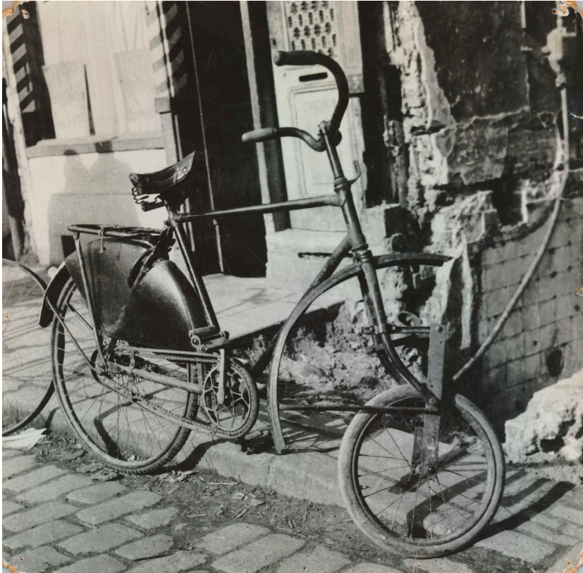
Illustratie 2 Fiets met autopedwiel

1942 en 1946. Hierbij moet wel vermeld worden dat dit een van de zoektermen was waarmee de voorlichtingsrapporten zijn verzameld, en we kunnen daarom geen uitspraken doen over de representativiteit. 71 Toch geeft de herhaaldelijke verwijzing naar de tijdsomstandigheden aan dat Bossche rapporteurs zich goed bewust waren van de impact van de bezetting op het leven en de keuzes van verdachten.