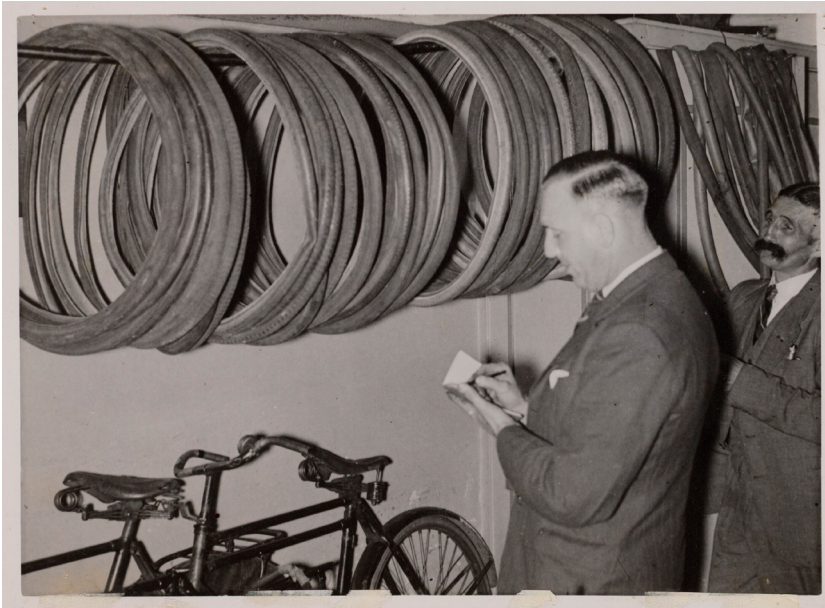
Illustratie 3 Rechercheurs inventariseren de buit van een fietsendief in zijn woning

rantsoenen voor gas en elektriciteit onvoldoende waren om voor iedereen te koken en stoken. Het Gerechtshof bepaalde dat deze diefstal van energie in 'landsbelang' was gepleegd en ontsloeg de man van rechtsvervolging. 114 De Hoge Raad bevestigde dit arrest. 115