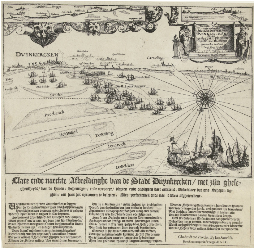
Illustratie 2 De Staatse vloot liggend voor Duinkerken, 1628