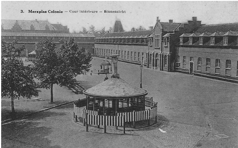
Illustratie 2: Zicht op de binnenplaats van de kolonie van Merxplas, eerste kwart 20ste eeuw, prentbriefkaart uit privé collectie Rik Vercammen.

woonde is niet duidelijk, maar alleszins lang genoeg om daar een onderstandswoonst te hebben verworven. Opvallend is dat hij in totaal tien keer veroordeeld zou worden voor landloperij en bedelarij, en dit zesmaal in Brussel, tweemaal in het nabije Schaarbeek, een keer in het aangrenzende Sint-Joost-ten-Node en een keer in Gent. De ene keer dat hij in Gent werd veroordeeld – zijn geboorteplaats – is eigenlijk het enige moment dat hij ergens buiten de Brusselse regio gelokaliseerd kon worden. Uit de briefwisseling in zijn dossier blijkt dat François C. geregeld in dienst was bij Brusselse werkgevers. Ten minste tweemaal leidde een schrijven van een werkgever aan de directie in Merxplas tot zijn vrijlating. Uit zijn dossier blijkt dat hij in Brussel een bestaan opbouwde, weliswaar onderbroken door een aantal verblijven in de Rijksweldadigheidskolonies.