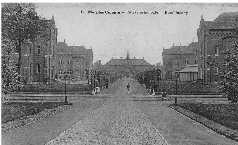
Illustratie 1: Zicht op de hoofdingang van de kolonie van Merksplas, eerste kwart 20ste eeuw, prentbriefkaart.

in grote getale in de Rijksweldadigheidskolonies terechtkwamen? In principe liet de vage formulering in het strafwetboek heel wat interpretatieruimte aan politie en gerecht om te bepalen wie als vagebond geormerkt werd. Zoals we in het artikel aantonen, werd deze interpretatieruimte op zeer verschillende wijzen ingevuld, waarbij mobiliteit lang niet altijd een doorslaggevende rol speelde.