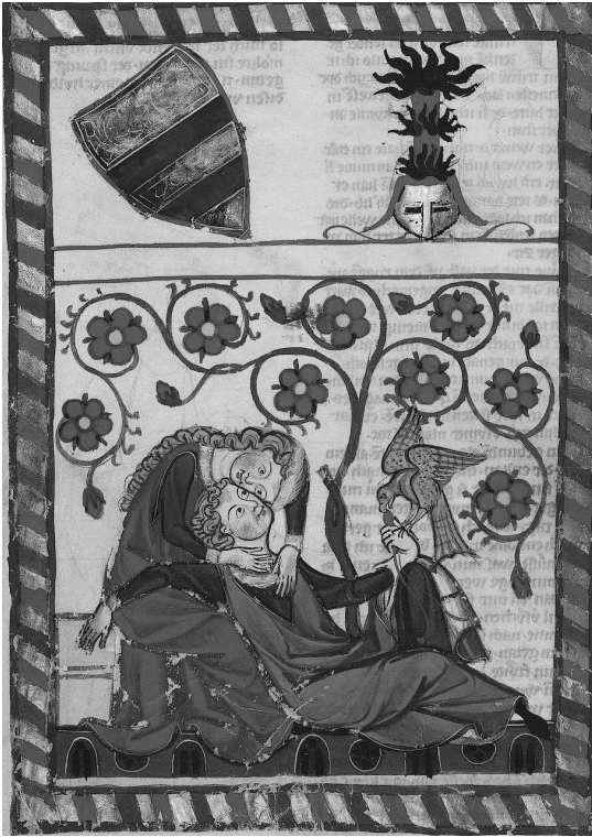
Illustratie 1: Liefde in de laatmiddeleeuwse literatuur – Große Heidelberger Liederhandschrift, fo. 249v., Zürich, ca. 1300 - ca. 1340. Bewaard in Universiteitsbibliotheek van Heidelberg (Codex Palatinus Germanicus – 849, http://digi.ub.uni-heidelberg.de/diglit/cpg848/0693 ).

ken ging vaak gepaard met geweld, dwang en verkrachting. 14 In het eerste geval gaat het om de schaking met de instemming van de vrouw, terwijl de schaking in het tweede geval tegen haar wil plaatsvond. De bronnen hebben zelf ook aandacht voor de aan- of afwezigheid van de instemming van de vrouw. Historici erkennen dan ook dat beide vormen bestonden, maar terwijl de eerst besproken groep gelooft dat het in de gevallen waar de bronnen om 'vrije wil' spreken ook echt om vrije wil ging, vermoedt de tweede groep dat de vrouw ook in die gevallen vaak slachtoffer was.