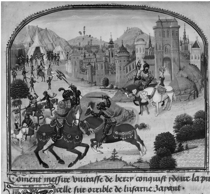
Illustratie 2: De schaking van Ydoire door Vuitasse de Berry – Miniatuur door Loyset Liédet en Pol Fruit in het handschrift Histoire de Charles Martel, geschreven in 1463–65 in Brussel; verluchting in 1467–72 in Brugge. Bewaard in The J. Paul Getty Museum in Los Angeles (Ms. Ludwig XIII 6, http://www.getty.edu/about/opencontent.html ).

matiek te eenzijdig belicht, door zich enkel op vonnisboeken te richten. Aangezien die bronnen informatie bevatten over de bestraffing, gaat ze uiteraard aan andere gevallen die mogelijk niet bestraft werden voorbij. Dit geldt niet enkel voor Greilsammer, maar ook voor andere historici als Vrolijk en Carlier. 67 Wanneer ook de schepenregisters worden onderzocht, blijkt immers dat de schakingen die daarin genoteerd staan, niet in de 'bestraffingsbronnen' voorkomen. Dit doet sterk vermoeden dat deze schakingen of toch zeker een deel ervan, niet vanzelfsprekend eindigden met een bestraffing, maar op een vrijspraak konden uitlopen zoals in het geval van Jan Uter Helcht en Elisabeth Lyedens. Ook andere historici bespraken gevallen die, nadat bleek dat de meerderjarige vrouw met de schaking had ingestemd, in overeenstemming met de wet niet bestraft werden. 68