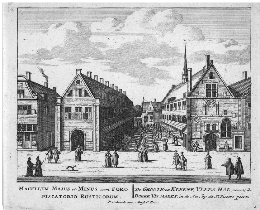
Afbeelding 2 Grote en kleine vleeshal te Amsterdam, naar Claes Jansz. Visscher (II) (1586-1652), die deze afbeelding in 1611 maakte.

Na de Alteratie van 1578, waarbij het katholieke stadsbestuur werd afgezet, kregen veel kerkelijke gebouwen een nieuwe functie. De kapel van het Sint-Pietergasthuis, links afgebeeld, werd een vleeshal, hetzelfde gebeurde met de kapel van het Margrietenklooster, rechts afgebeeld. In het midden is de visbank van de boerenvismarkt te zien.