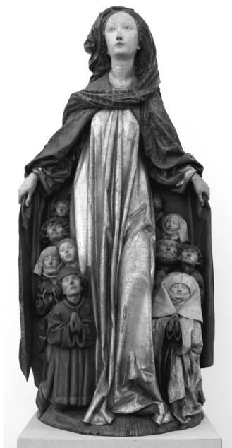
Afbeelding 1 Ravensburger Schutzmantelmadonna (1480)

hij al en zijdy gheen groote rente coopers, ghetrouwen aerbeydt is hooghe ghetelt : ‘jullie investeren wel niet in financiële instrumenten, maar jullie werk wordt hoog geacht [door God]. 4 De rederijker geeft met deze passages aan dat sparen en investeren in financiële instrumenten, zoals een lijfrente, manieren waren om zich van een zorgeloze oude dag te voorzien. Daarin staat hij niet alleen: in de middeleeuwse didactische literatuur roepen auteurs hun lezers regelmatig op te sparen voor hun oude dag op straffe van de schandelijke gang naar het armenhuis. 5 In dit artikel staat de vraag centraal hoe reëel zulk advies was.