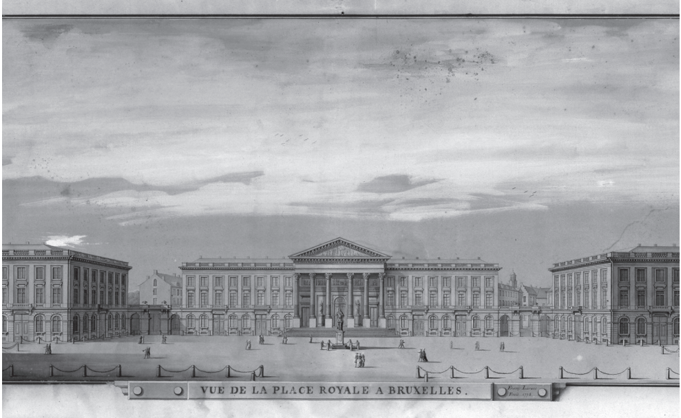
Afb. 2 Het Brusselse Koningsplein in 1778 door François Lorent (Museum van de stad Brussel).

zelf door te stoten tot het bestuurserchelon, om zo mee te wegen op het corporatief beleid? Om op deze vragen een antwoord te bieden gaan we in het volgende onderdeel nader in op het bestuursniveau van het Vier Gekroonde-nambacht: de dekens.