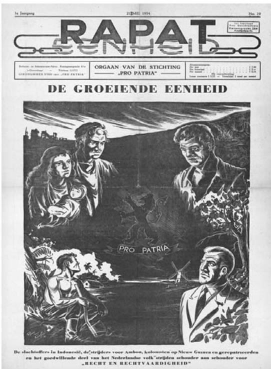
Rapat 1954.

de propagandisten van de Rijkseenheidsbeweging, voor wie er een nauwe samenhang bestond tussen de Nieuw-Guinea kolonisatie en de steun voor een onafhankelijke Republiek der Zuid-Molukken (met onder meer de eilanden Buru, Seram, Amboina, Aru, Wetar) een gebied dat (zuid)westelijk aan Nieuw-Guinea grensde. Gerbrandy, die zich zo had gekeerd tegen een vergelijk met de Republiek, was ook een prominente pleitbezorger van de Molukse zaak. Oude koloniale banden tussen Nederland en Ambon, maar ook een gedeeld protestants-christelijke geloof en Ambonees verzet tegen de Japanse bezetter, waren de belangrijkste bestanddelen van deze solidariteit. De Republiek Maluku Selatan (RMS) die op 25 april 1950 was uitgeroepen, was een half jaar later al weer onder de voet gelopen door Indonesische troepen. De solidariteitsbeweging Door de Eeuwen Trouw (DDET) wist echter nog jarenlang aanzienlijke steun onder de Nederlandse bevolking te winnen voor de Molukse zaak. Het had in de jaren vijftig een veertigtal afdelingen door heel Nederland en bracht een blad De Stem van Ambon uit dat begin jaren vijftig zo'n 20.000 abonnees telde. 60