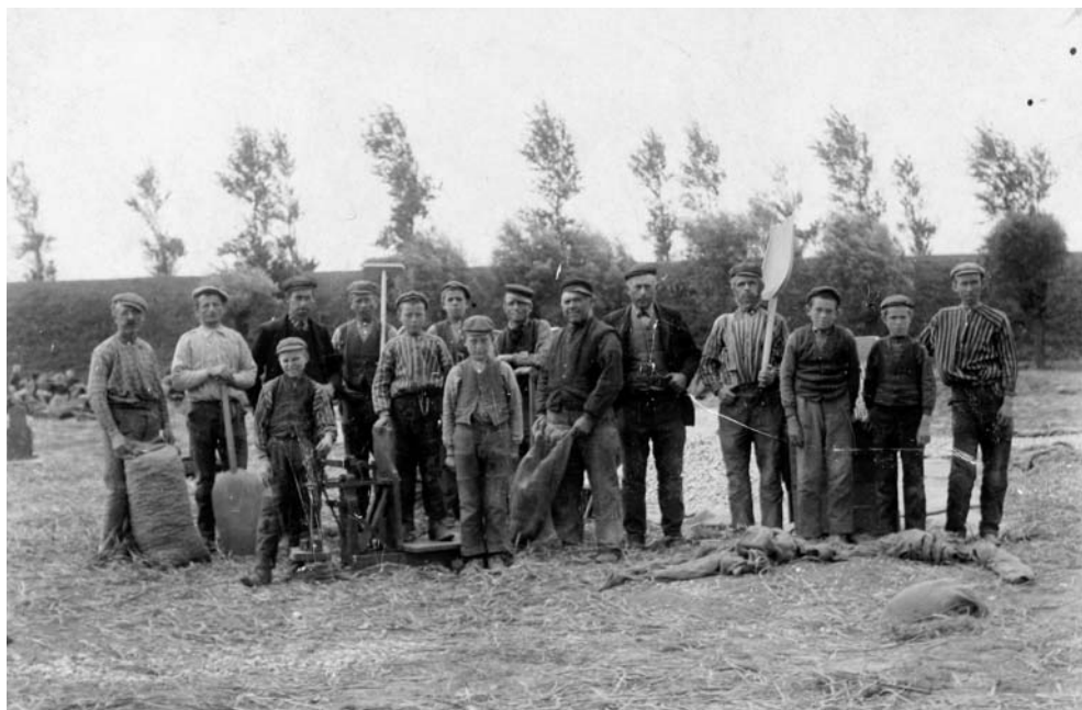
Een groep landarbeiders in Sint Annaland (Tholen), circa 1910.