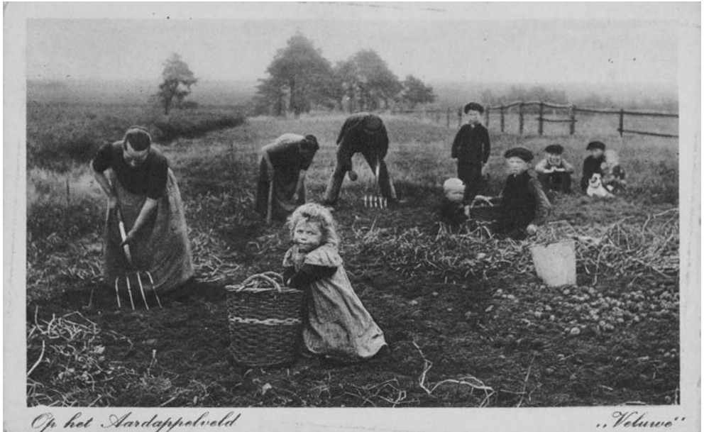
'Op het aardappelveld. Veluwe'. Ansichtkaart uit 1915-1925.

Over de intensiteit van dit werk kunnen op grond van de enquêtes nauwelijks exacte uitspraken worden gedaan. Slechts af en toe wordt vermeld hoeveel kinderen van een bepaalde school of leeftijdsgroep werken en hoeveel uren of dagen zij dat doen. Meestal blijft het slechts bij een indruk. Wel worden interessante patronen zichtbaar.