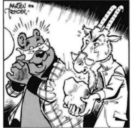
Afb. 2 Heer Bommel en de zonnige kijk, strip 8601, derde plaatje, copyright ©1975 Stichting Het Toonder Auteursrecht.

Wat kunnen we doen? In de wereld van Heer Bommel bestaan twee modellen: Professor Sickbock en professor Prlwytzkofski. In afbeelding 2 zien we Professor Sickbock. Hij had geld nodig om zijn laboratorium weer op te bouwen, nadat het vorige door zijn gepruts was verwoest. Sickbock weet Bommel te strikken om dat te financieren met de claim dat hij goud kan maken. Nadat Sickbock Bommel een roze bril op heeft gezet gelooft de laatste inderdaad dat Sickbock daarin zal slagen. Wij zouden de roze bril kunnen vertalen met 'instituten', 'sociaal kapitaal', of met een of andere dure economische formule. Zulke listen kunnen slagen, maar dat willen wij niet echt, want als de roze bril inhoudelijk niet wordt uitgewerkt val je op den duur door de mand. Daarom weet Professor Prlwytzkofski ook Professor Sickbock te ontmaskeren. In afbeelding 3 leest Prlwytzkofski net over de claim dat men goud kan maken: 'Praw, door nieuwer gouddekking meer geld vervoegbaar. Afkoeling van financieel klimaat. Wel ener kinderij. Alsof geld wichtiger is dan duchtiger wetenschappelijker arbeid!'. Zijn assistent Alexander Pieps (in het geheel niet vergelijkbaar met onze huidige promovendi!) rent juist bin-