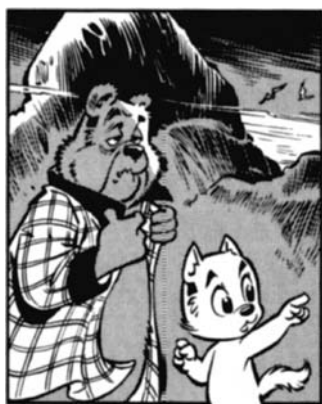
Afb. 1 Tom Poes en de kaligaar, strip 8197, tweede plaatje, copyright ©1975 Stichting Het Toonder Auteursrecht.

Over generaties en de toekomst van het vak 1