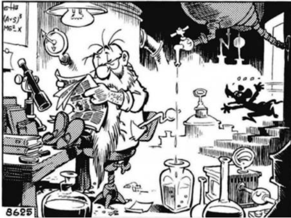
Afb. 3 Heer Bommel en de zonnige kijk, strip 8625, eerste plaatje, copyright ©1975 Stichting Het Toonder Auteursrecht.

nen met hetzelfde nieuws. Maar is Prlwytzkofski wel het ideaal waar wij naar moeten streven? Eigenlijk ook niet, want het kan hem nooit schelen of iemand zijn onderzoek belangrijk vindt of niet: het gaat hem alleen maar om de wetenschap. Dat lijkt mij ook niet wenselijk.