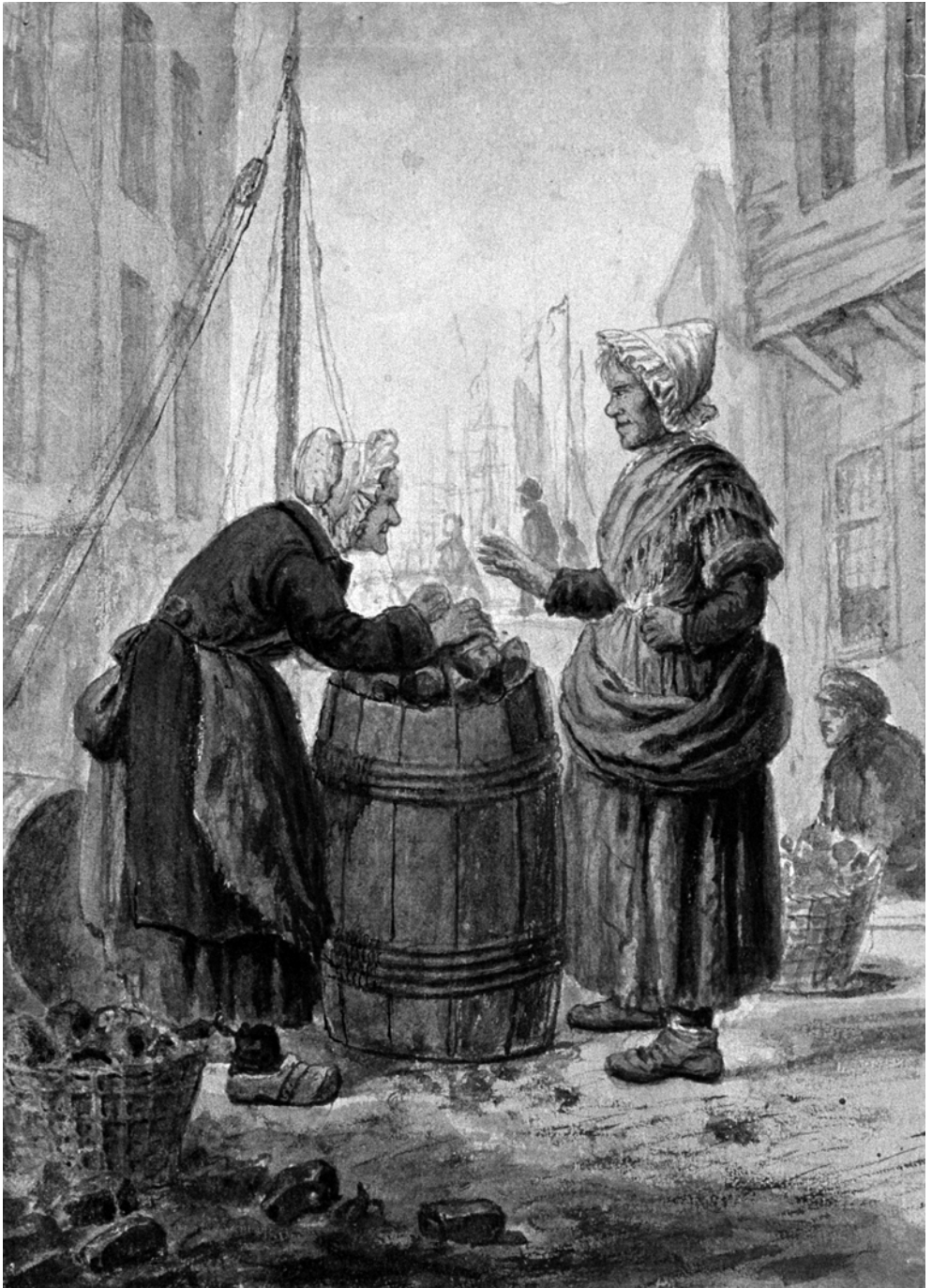
Turfjonsters aan 't werk. Waterverftekening door W.P. van Geldorp, 1864.