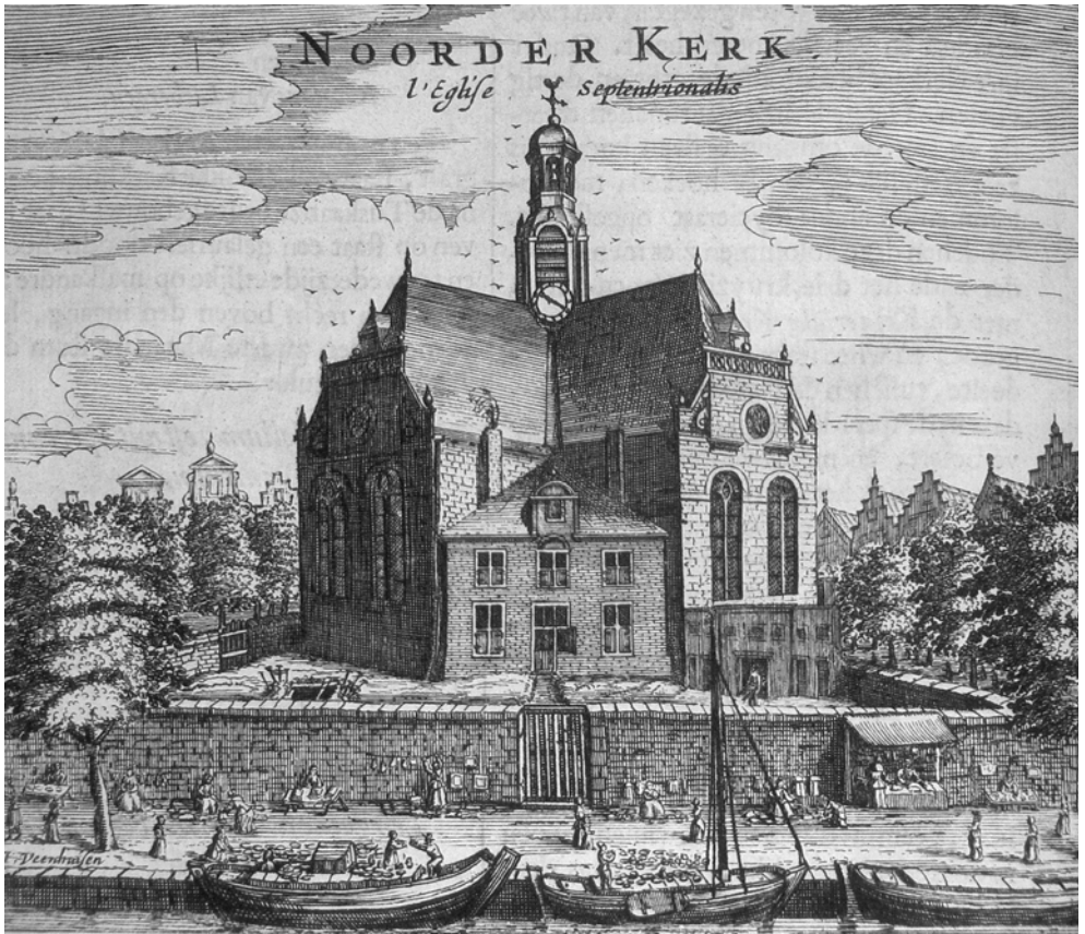
Markt aan de Prinsengracht ter hoogte van Noorderkerk en Noorderkerkhof.

Dam en langs de Kalverstraat. Een aantal radialen in de grachtengordel en de radiaal van de Dam in zuidoostelijke richting door Halsteeg (nu Damstraat), Oude Doelenstraat en Hoogstraat waren eveneens goed voorzien van dit type winkels. Op de Noordermarkt daarentegen, werd geen enkele winkel in deze branche aangetroffen en aan de Nieuwmarkt slechts één. Wel tekent zich op de kaart een concentratie af op de Prinsengracht tussen Tuinstraat en Egelantiersgracht. De boedelinventarissen die bij het faillissement zijn opgemaakt, wekken de indruk dat het hier om betrekkelijk marginale winkeltjes ging, hetgeen ook verklaart waarom er in het register van de Personele Quotisatie geen Franse winkelhouders en galanteriewinkeliers op deze locatie worden aangetroffen. 59