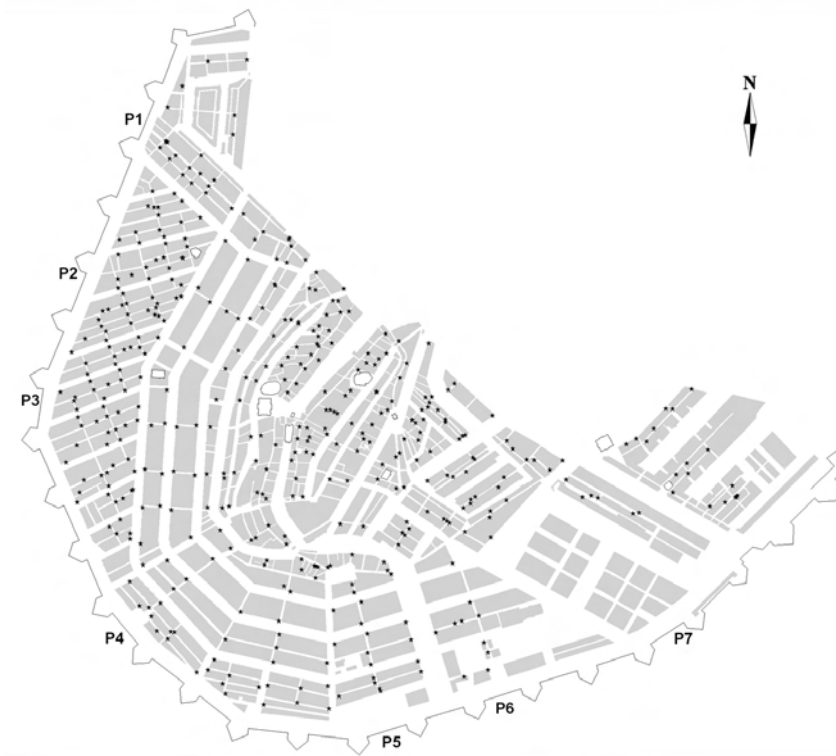
FIGUUR 4 Locatie van bakkerszaken, 1742

Voor dagelijkse behoeften als brood wenste ook de vroegmoderne consument immers geen grote afstanden af te leggen. 49