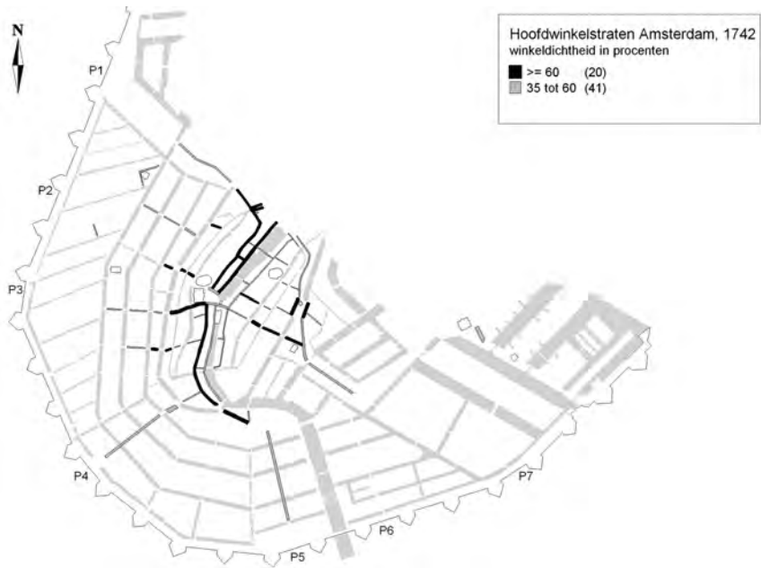
FIGUUR 2 Hoofdwinkelstraten in Amsterdam, 1742

as Warmoesstraat-Nes. Aansluitend bij deze hoofdassen zijn er de radialen die de binnenstad doorsnijden en tevens een verbinding leggen met de meer perifere delen van de stad en met de wereld buiten de stadspoorten. Tot slot zien we nog enkele min of meer geïsoleerde clusters van winkeliers met voldoende inkomen voor registratie in de Personele Quotisatie. In het westen van de stad zijn zij gevestigd aan de Noordermarkt en in de Tweede Egelantiersdwarsstraat (beide gelegen in de Jordaan) en in het oosten van de stad aan het Kattenburgerplein op de Oostelijke Eilanden.