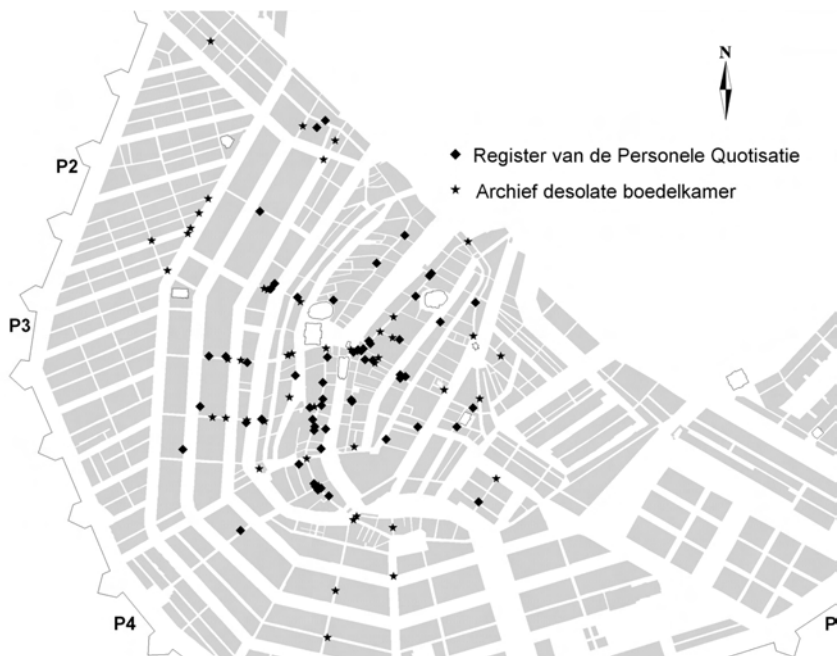
FIGUUR 6 Locatie van Franse winkels en galanteriewinkels in het register van de Personele Quotisatie (1742) en het archief van de desolate boedelkamer (1777-1795)

De beperkingen van het bronnenmateriaal staan geen heel harde conclusies toe, maar enkele zaken zijn wel duidelijk. Het spreidingspatroon van beddenwinkels, Franse winkels en galanteriewinkels bevestigt het belang van de centrale winkelassen in het centrum en van de radialen bij het aanbod van semiduurzame en duurzame consumptiegoederen in Amsterdam. Maar tevens weten we nu dat dit soort goederen ook elders in de stad werd aangeboden en dat dit aanbod, in overeenstemming met het karakter van 'shopping goods', doorgaans geconcentreerd was in clusters van winkels binnen dezelfde branche. Tot het ontstaan van wat in moderne termen secundaire winkelcentra zouden worden genoemd, is het evenwel niet gekomen. De Noordermarkt en Nieuwmarkt functioneerden niet als een omvangrijke en gevarieerde winkelvoorziening voor de perifere wijken. Eerder lijkt er sprake te zijn geweest van brancheclustering op het niveau van straten. Voor bedden, kussens, beddengoed en aanverwante zaken gingen de Jordaanbewoners naar de Noordermarkt en voor de aanschaf van modeartikelen winkelde men aan de Prinsengracht. 60 Het lijkt niet te gewaagd te veronderstellen dat een vergelijkbaar patroon ook bestond voor andere branches in de sector semiduurzame en duurzame consumptiegoederen.