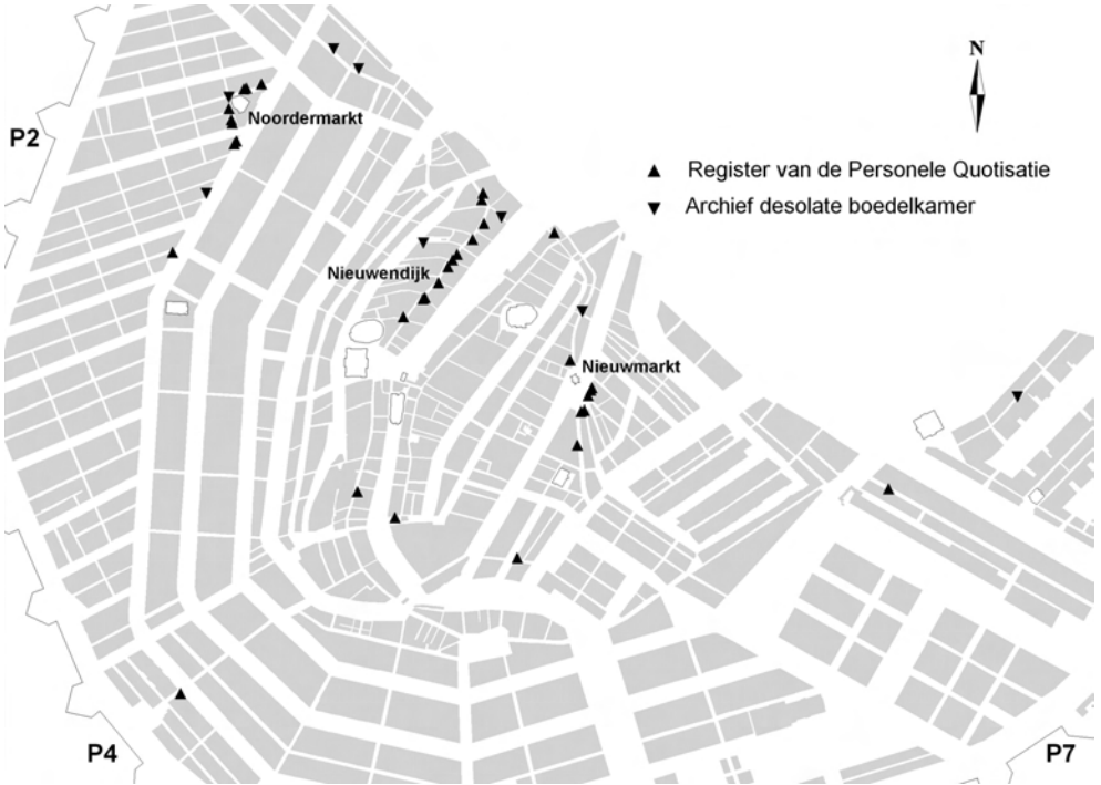
FIGUUR 5 Locatie van beddenwinkels in het register van de Personele Quotisatie (1742) en het archief van de desolote boedelkamer (1777-1795)

In figuur 5 is de locatie aangegeven van alle beddenwinkels die in het register van de Personele Quotisatie worden aangetroffen en tevens de locatie van de acht beddenwinkeliers die failleerden en derhalve vermeld worden in het archief van de desolote boedelkamer over de jaren 1777-1795. 57 Daarbij dient wel aangetekend te worden dat de adresgegevens uit het register van de Personele Quotisatie nauwkeuriger zijn dan die in de dossiers van de boedelkamer , waar globale aanduidingen als ‘op de Haarlemmerdijk bij de Buiten Brouwerstraat’ gebruikelijk zijn. Niettemin is het beeld helder. Beddenwinkels, waar men naast matrassen ook kussens, dekens en beddengoed verkocht, vertoonden een drietal concentraties: Noordermarkt, Nieuwendijk en Nieuwmarkt. Buiten de onmiddellijke omgeving van deze winkelconcentraties werden blijkbaar maar weinig beddenwinkels aangetroffen. Dat is in overeenstemming met het (semi-) duurzame karakter van bedden en beddengoed; artikelen waarbij de klant uitvoerig wil vergelijken op prijs en kwaliteit alvorens tot aankoop over te gaan. Evenmin hoeft het te bevreemden dat de Nieuwendijk het grootste aantal beddenwinkels telde. Die straat ligt immers