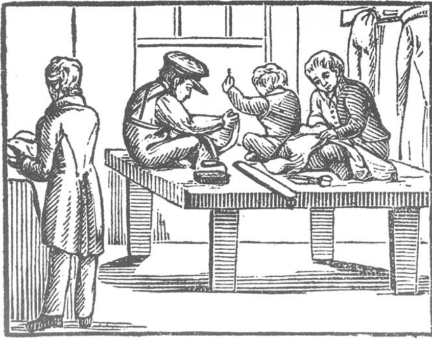
Jongens aan het werk bij een kleermaker, 1819.

doorgaans met acht à negen jaar te werken – in extreme gevallen zelfs al eerder – in takken van nijverheid met grote behoefte aan ongeschoolde arbeid. Dit waren bijvoorbeeld spinnen en knoopp maken, en economisch belangrijke stedelijke neringen als de Leidse textiel of de Goudse pijpmakerij. Kinderen die door hun ouders werden besteed waren daarentegen meestal ouder dan tien jaar. Het is aannemelijk dat deze ouders over de middelen beschikten om hun kinderen tot die leeftijd algemeen onderwijs te laten volgen. Met twaalf tot veertien jaar was voor veel kinderen de tijd aangebroken om – al werkend – een ambacht te leren.