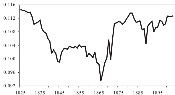
FIGUUR 2. Som van de gekwadrateerde residuen: consumptie met reeksbreuk

ben ontwikkeld en die hebben laten zien dat de Nederlandse economie in de tweede helft van de negentiende eeuw steeds meer de internationale conjunctuur gaat volgen. 28 Ook in het geval van de ontwikkeling van de particuliere consumptie lijkt het steekjaar 1889 een breukvlak te zijn. Kennelijk is de ontwikkeling van de consumptieve bestedingen in sterke mate – en op positieve wijze – beïnvloed door de opgaande fase in de internationale conjunctuur vanaf de jaren negentig van de negentiende eeuw tot aan de Eerste Wereldoorlog.