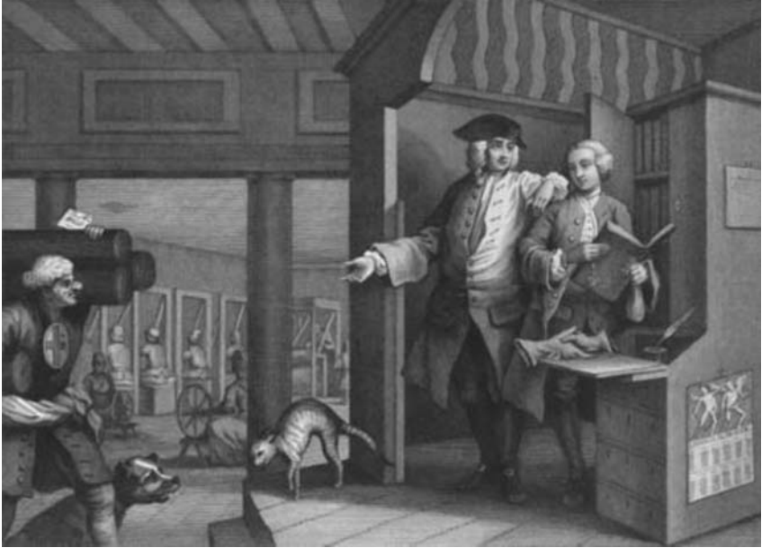
William Hogarth, The Industrious 'Prentice a favourite entrusted by his Master (Plaat 4 van de reeks Industry and Idleness , 1747)