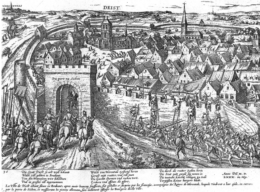
Illustratie 1: Zicht op Diest vanuit het westen, naar aanleiding van de inname van de stad door Staatse troepen in juni 1580.

Deze steden kwamen in de late vijftiende en vroege zestiende eeuw tot grote bloei mede dankzij de aanwezigheid van hun machtige heren. Zij begiftigden hun steden met kapittels en kloosters, richtten (jaar)markten in en trokken geldwisselaars en lombarden aan. 26 Het afwijkend traject van Diest in vergelijking met Lier en Breda stemt tot nadenken over het aandeel van de heer in het politieke netwerk van een stadsheerlijkheid.