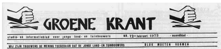
Afbeelding 2: Vignet van de Groene Krant, maandblad van de KLJ (Katholieke Landelijke Jeugd), eerste nummer 1973

laten met de spanning tussen landbouw en ruimtelijke ordening, biologische teeltwijzen, natuurbehoud en milieu, dierenwelzijn, ruraal wonen en hoevertoerisme. De koerswending kan soms drastisch ogen: het vakblad Le Courier horticole (1946) werd omgedoopt tot Jardin et Logis (1969), Landei-gendom (1947) werd Rondom Wonen (1994).