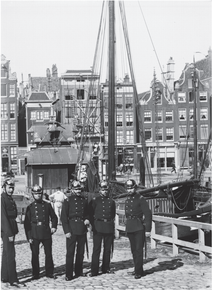
Illustratie 1 Amsterdamse politie op het Damrak (ca. 1892) (bron: Stadsarchief Amsterdam, Collectie Jacob Olie Jbz., 10019A000118).